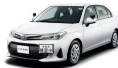
(新型トヨタ 教習車)