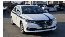
(プレミオ・アリオン タクシー)