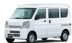
(クリッパーバン・エブリイバン)