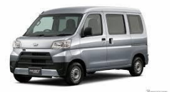
(ダイハツ ハイゼット)