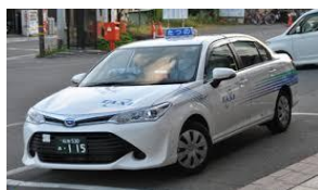
(新型カローラアクシオタクシー)